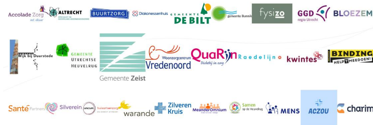
Figuur 2. Deelnemende partijen van ZOUV